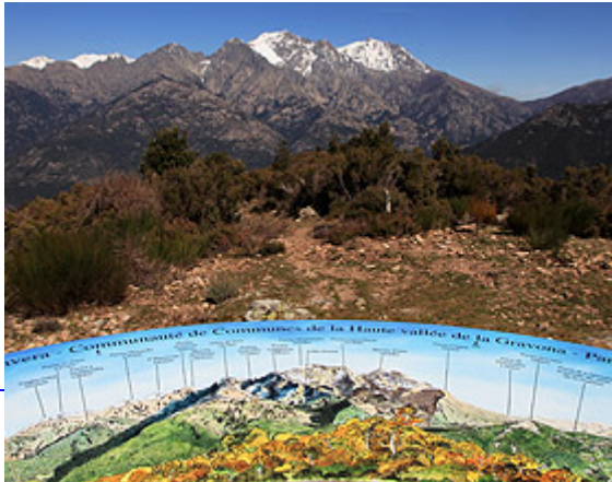
Col de Scaella

Point de passage entre les vallées de la Gravona et du Prunone