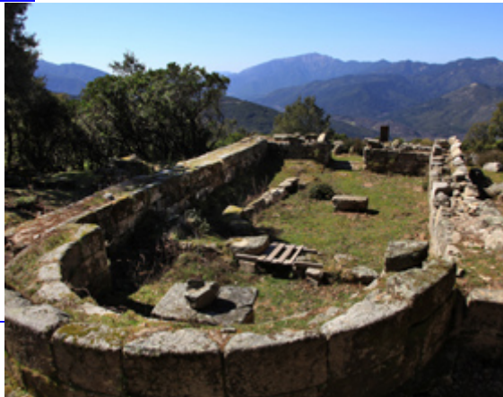
Chapelle de San Polu

Daté de la fin du XIe, début XIIe siècles, l'édifice